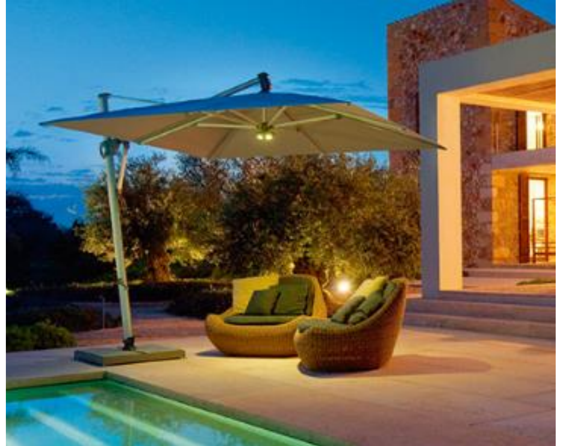
NEW TESS QUADRADO