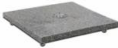
Base granito 120kg

Para os tamanhos \varnothing 4\text{m} e 3,5 \times 3,5\text{m}