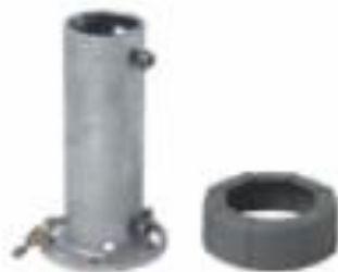
Prolongador galvanizado com acabamento