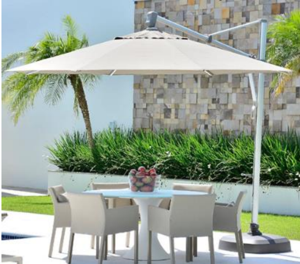
NEW TESS REDONDO