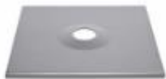
Placa de montagem galvanizada