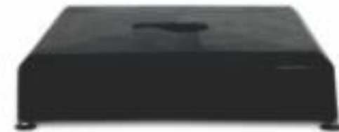
Base desmontável para ombrellone

Para os tamanhos \varnothing 4\text{m} e 3,5 \times 3,5\text{m}