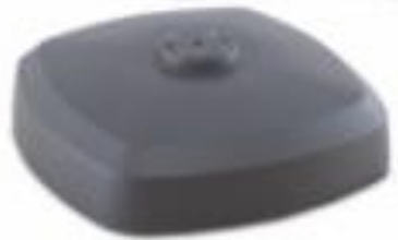
Base desmontável para ombrellone

Para os tamanhos \varnothing 3,5\text{m} e 3 \times 3\text{m}