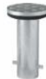
Base galvanizada para concretagem