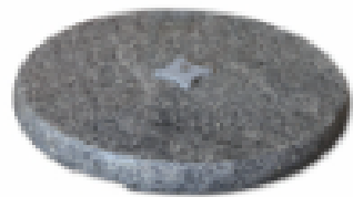
Base granito 90kg