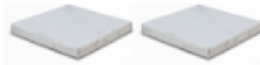
Pedra concreto 45x45cm (são necessárias 4 pedras por ombrellone)