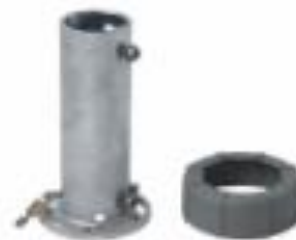
Prolongador galvanizado com acabamento