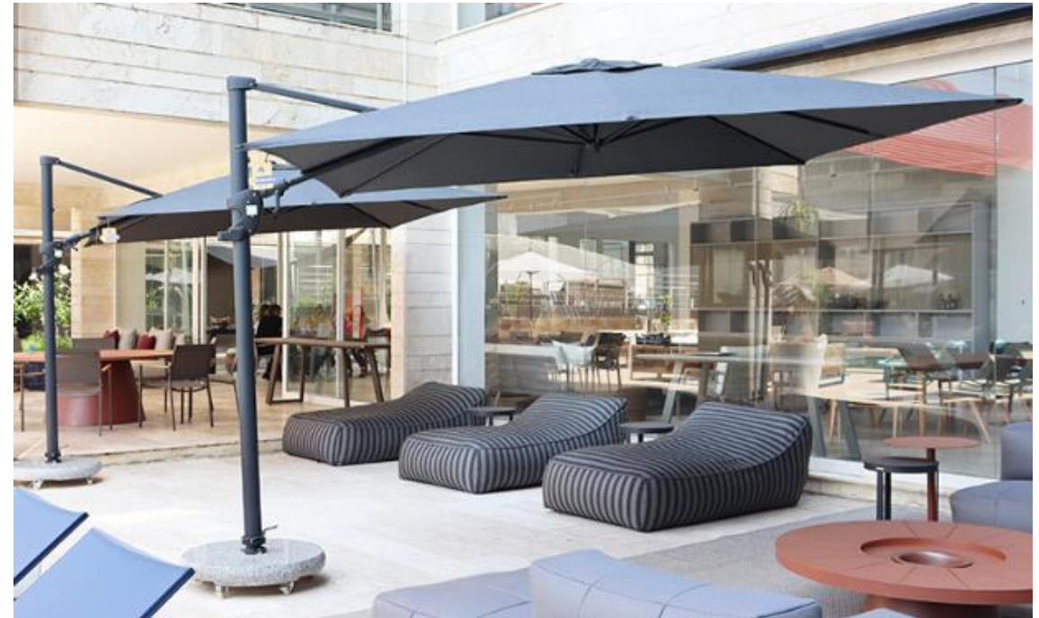
TESS 15 QUADRADO