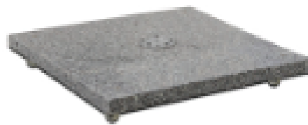
Base granito 120kg